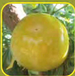
BLONDY® 79 Breeder: Provedo